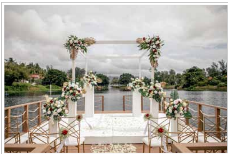
Dags för bröllop vid Banyan Tree Phuket.