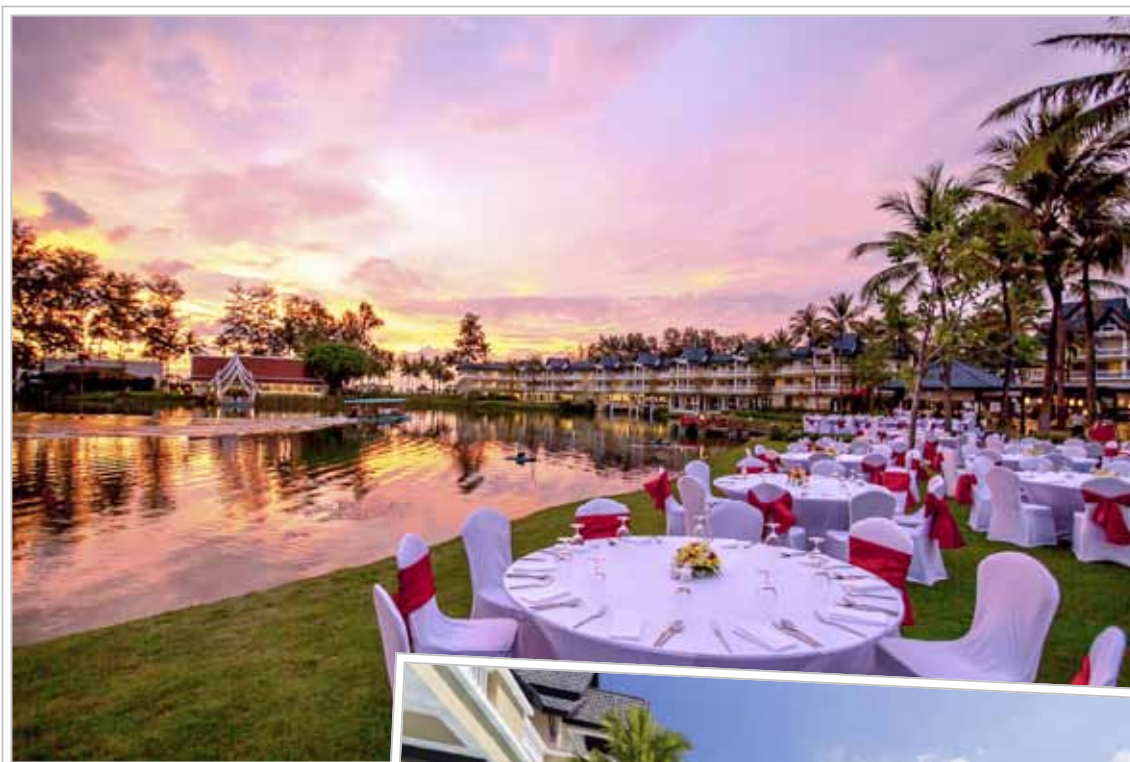
Angsana Laguna Phuket har södra Thailands längsta pool, hela 323 meter slingrar den sig fram mellan de olika byggnaderna. På sina ställen har den även sandbotten.