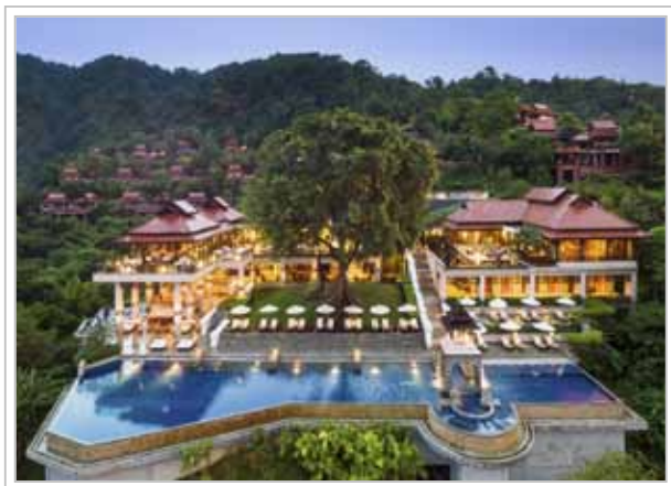
Pimalai Resort and Spa.

Eftersom Koh Lanta ligger söder om Andamankustens främsta turistmål har ögruppen lyckats behålla sin avslappnande atmosfär och fantastiska natur. Här finns regn- och mangroveskog, vattenfall och skogsklädda kullar och längs med kusten, från norr till söder, sträcker sig en asfalterad väg som leder till, kanske den vackraste nationalparken av dem alla, Mu Koh Lanta.