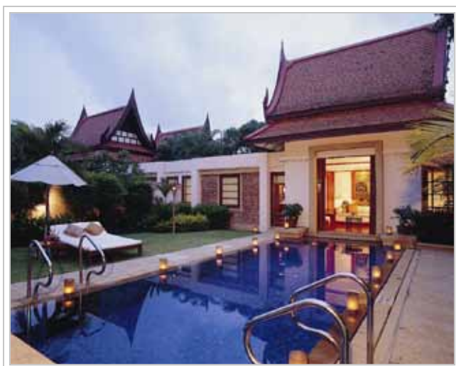
Signature Pool Villa på Banyan Tree Phuket.