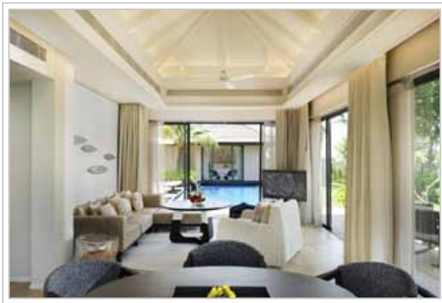
Boende på Shell Sea Krabi.